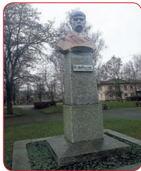
Пам'ятник Т. Шевченку у Криничках.

- Україна сьогодні у великій небезпеці, а війни, як говорили Бісмарк і Черчіль, виграють проповідники і вчителі. Високохудожній твір Народного художника України, автора скульптур молодого Шевченка, Валерія Чкалова, Олександра Поля у Дніпрі В. Небоженка наснажує наших земляків на боротьбу за волю в сьогоднішній війні з Московією. З цією ж метою наші фермери на початку року замовили скульптору погруддя Тараса Шевченка для 28-ї школи міста Дніпра, де навчається чимало дітей, там п'ять перших класів. Відтепер усі лінійки, урочисті заходи проходять у шкільному вестибюлі зі зримим образом Батька української нації, який сіяти-ме в юних душах вічні зерна любові до рідного народу. Заклик Тараса до волі мусимо дієво підтримувати, тоді на нашій землі пануватимуть добро і правда.